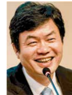
国际认可论坛 (IAF) 主席 肖建华